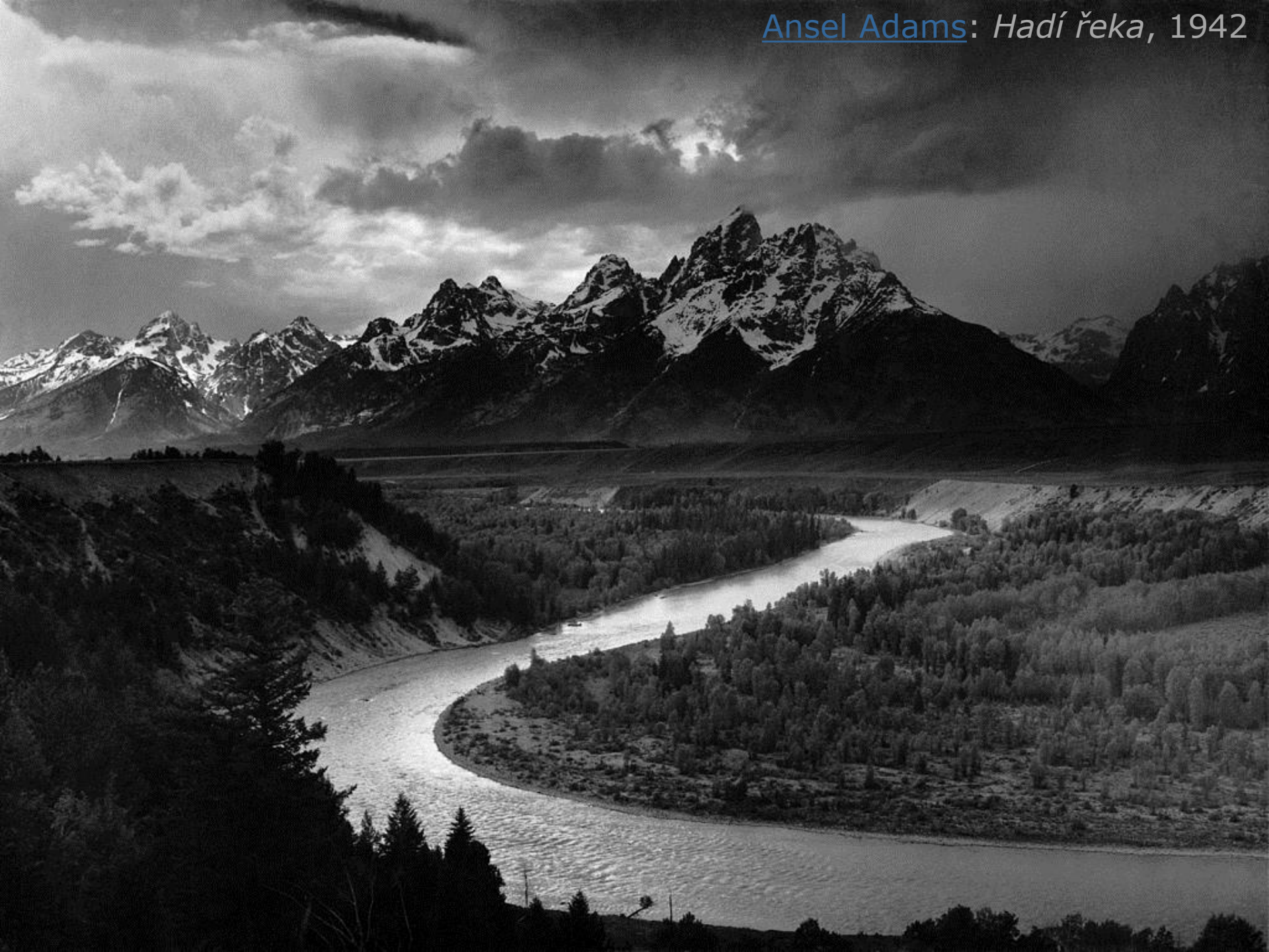
Ansel Adams : Hadí řeka , 1942