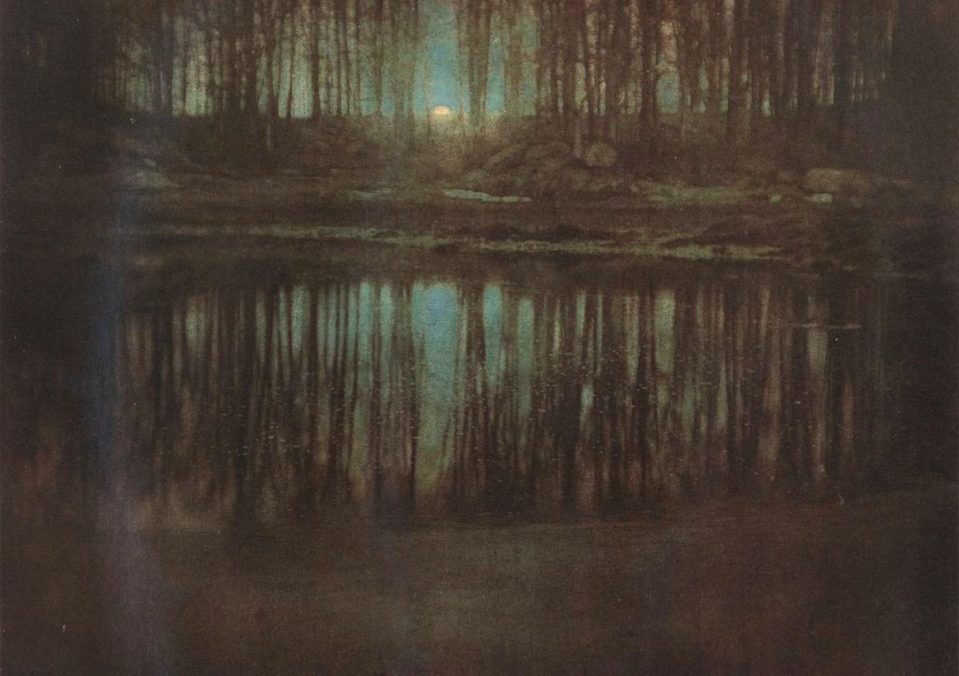
Edward Steichen, The Pond-Moonlight , 1904