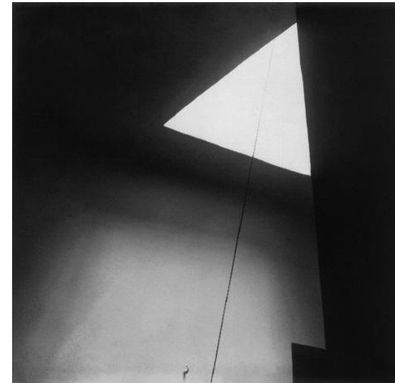
Jaroslav Rössler (1902–1990)