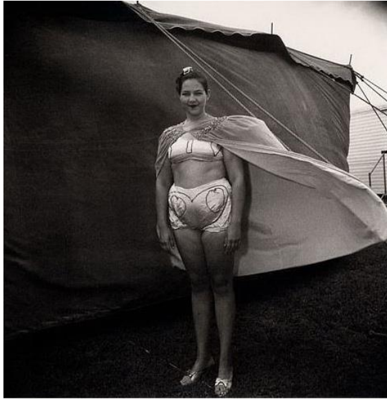
Diane Arbus (1923 – 1971)