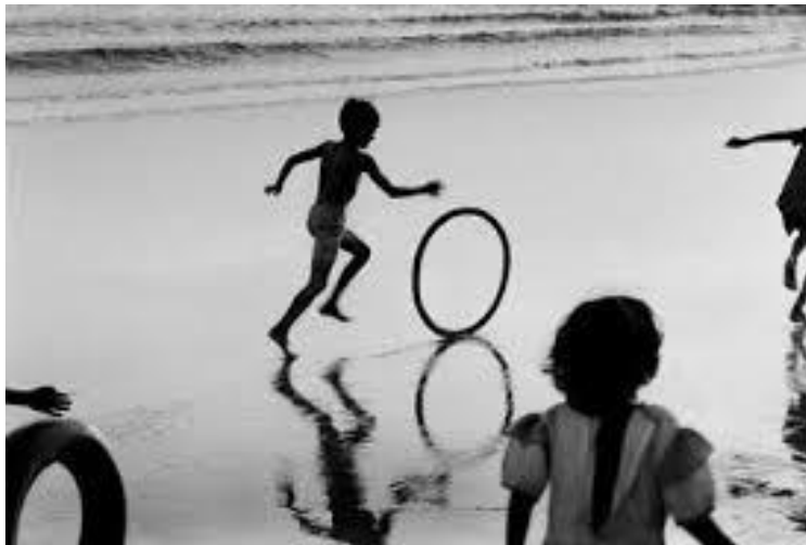
Henri Cartier-Bresson (1908 – 2004)