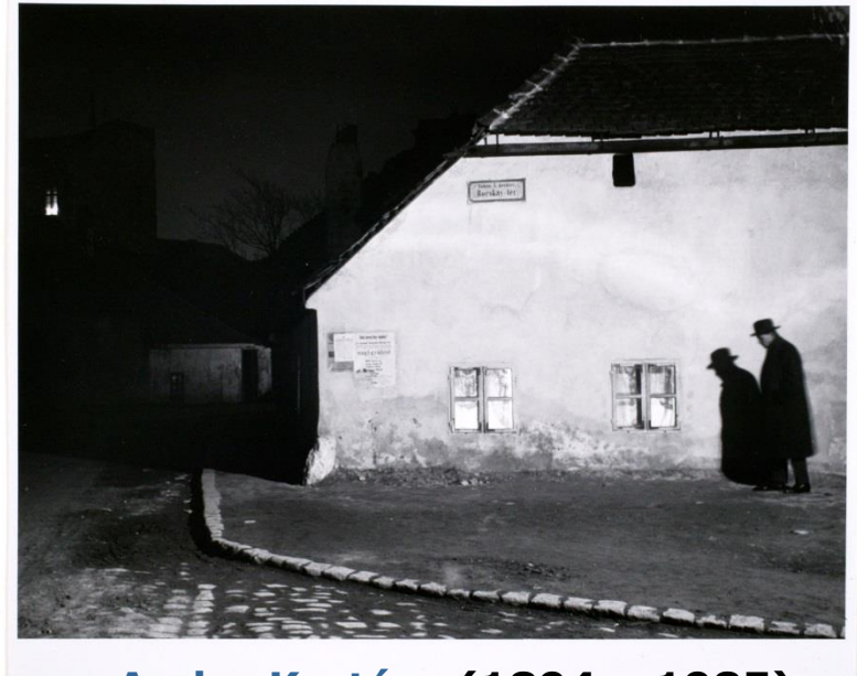
Andre Kertész (1894 – 1985)