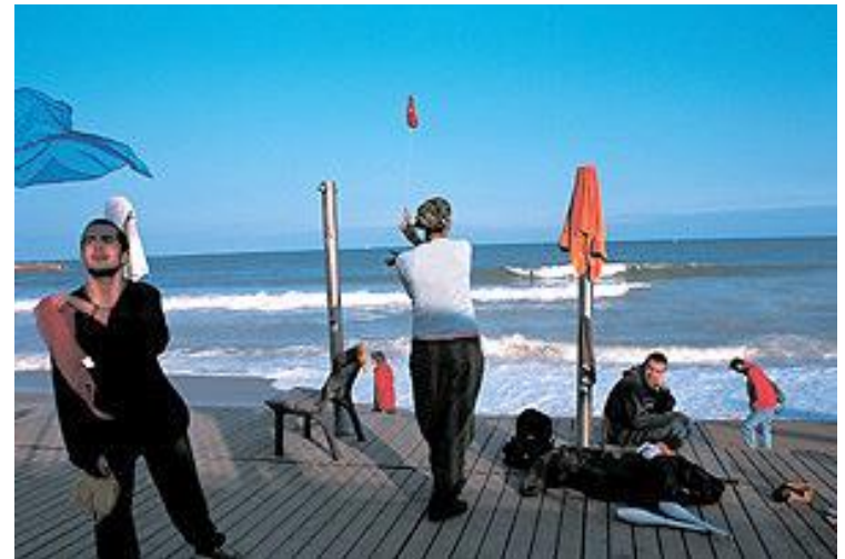
Vladimír Birgus (* 1954)